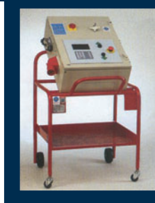
Unità di comando carrellata Control unit on separate mobile desk Pupitre de commande sur console mobile Schaltaggregat auf mobilem Steuerpult